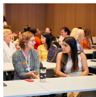
Des participantes à la Convention Internationale 2022 à Hambourg ont pris part au programme de tutorat « Des Filles géniales rencontrent des Femmes géniales »